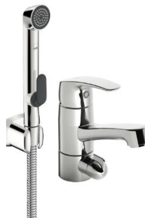
Oras Safira 1014F