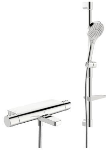
Oras Optima 7149N