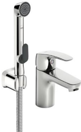
Oras Safira 1012F