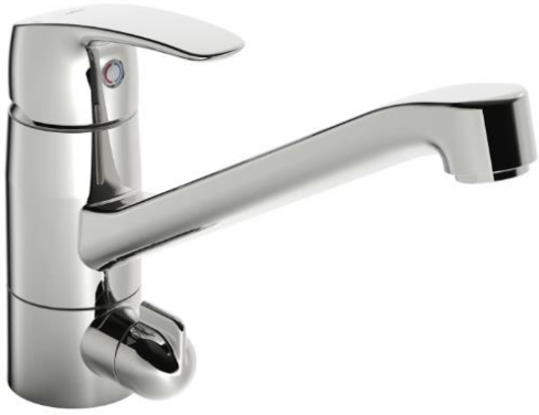
Oras Safira 1035FS